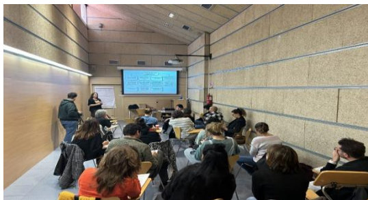
Psühholoogide koolitus Hispaanias

2024. aasta aprillis viis ABD projekti Care4Trauma raames läbi neli koolitust, mis olid suunatud psühhosotsiaalse toe spetsialistidele, kes pakuvad tuge soolise vägivalda ohvriks langenud naistele. Kaks koolitust viidi läbi veebipõhiselt ja kaks kontaktkoolitusena Barcelonas ja Madridis. Koolituste eesmärk oli anda osalejatele baastadmised traumast ja õpetada neid rakendama traumat arvestava praktika meetodikat. Kokku osales koolitustel üle 100 inimese, kes näitasid suurt huvi rakendada teenuste osutamisel traumat arvestavat praktikat.