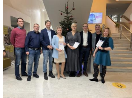
Kohtumine Eestis, 21.12.2023

Kokkuvõtvalt, traumat arvestavate praktikate poliitikakujundajatele propageerides püüti toetada traumast taastumist, vastupanuvõimet ja ühiskondlikku heaolu, luues seeläbi tähelepanelikumaid ja toetavamaid kogukondi.