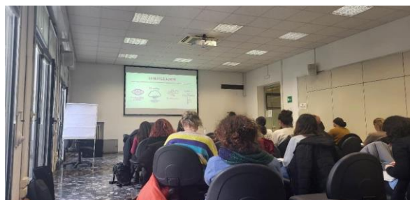
Sotsiaalvaldkonna töötajate koolitus Bolognas