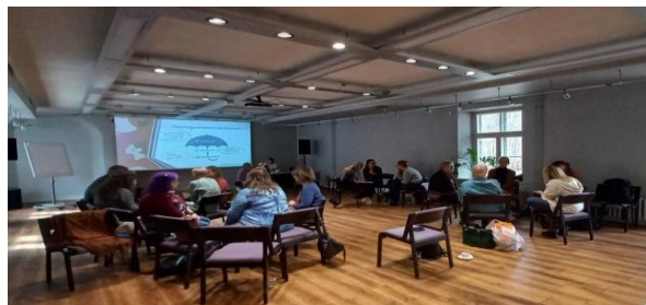
Psühholoogide koolitus Tartus