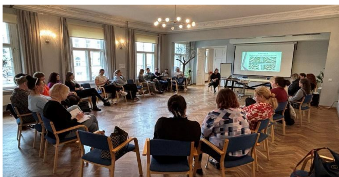
Sotsiaalvaldkonna töötajate koolitus Tallinas