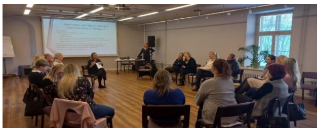
Sotsiaalvaldkonna töötajate koolitus Tartus